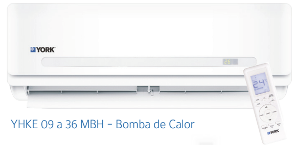
YHKE 09 a 36 MBH - Bomba de Calor

La condensadora (unidad externa) y evaporadora (unidad interna) están diseñadas para un funcionamiento silencioso.